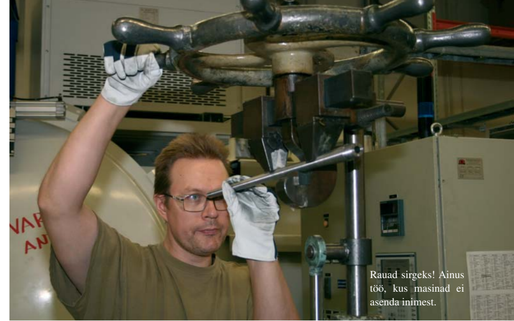
Rauad sirgeks! Ainus töö, kus masinad ei asenda inimest.

Beretta kontsernil on kõige otsesem side nende riikidega. Hiinas kuulub Berettale õhkreelvasid tootev tehas, mis toodab õhkreelvi Stoeger kaubamärgi nimega. Stoeger nimega on seotud ka Türgi, kus asub samanimeline tehas, kus valmistatakse poolautomaatseid haavlipüsse samuti Stoegeri kaubamärgiga. Tegemist on samuti Beretta